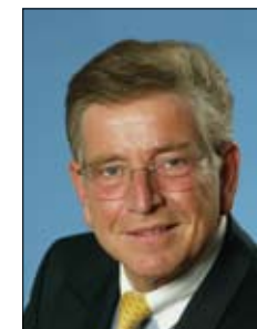
Dr. Thomas Goppel Präsident des Bayerischen Musikrates