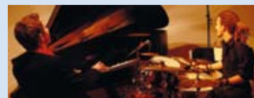
Titelbild: „Imbrothersation“