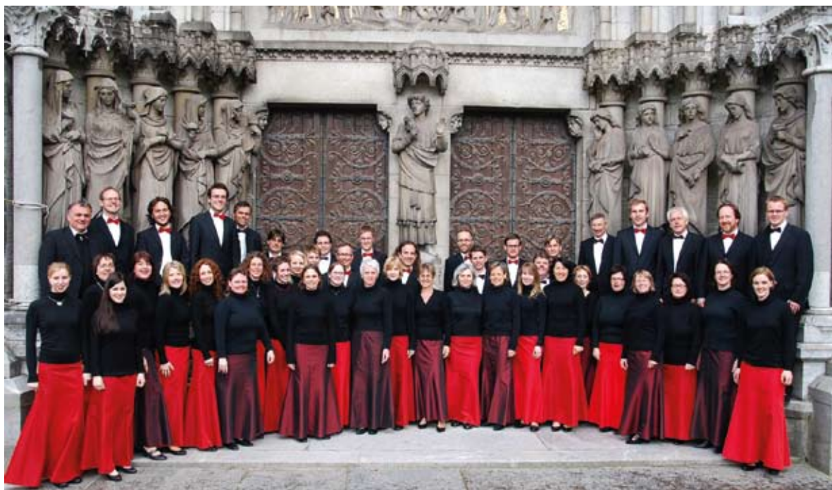
Das Heinrich-Schütz-Ensemble Vornbach gestaltet als einer der Wettbewerbschöre ein Studiokonzert in der Dominikanerkirche