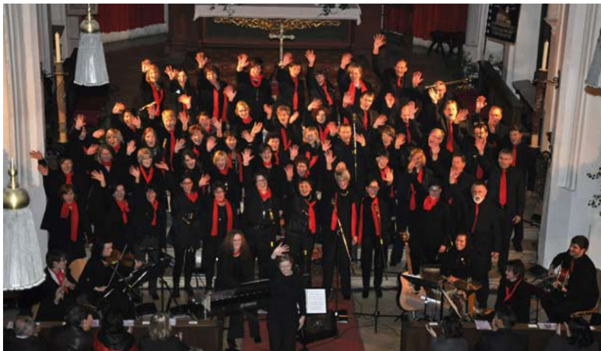
Belcanto Chor – 60 Sängerinnen und Sänger erhoben die Stimme zugunsten schwer- und schwerstkranker Kinder und für Senioren