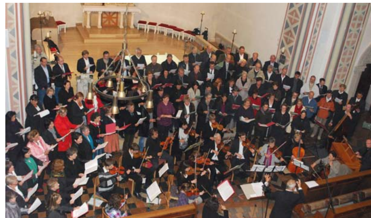
Abschlusskonzert des Seminares in der Kirche St. Cäcilia, Regensburg

Deutsche Chorjugend e.V. Der Bundesvorstand