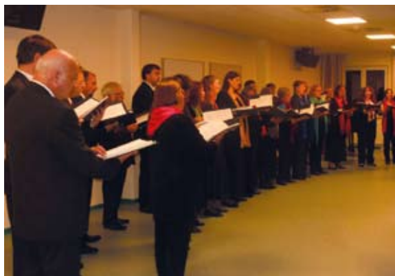
Erfahrene Sängerinnen und Sänger hat der Kammerchor des Bayerischen Sängerbundes in seinen Reihen – die meisten leiten selbst einen Chor.