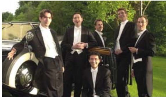
„Die Pinguin-Singers“ waren lange Jahre Mitglied im BSB

Nach über 23 Jahren auf der Bühne hängen die Sänger des Münchner Vokalensembles „Die Pinguin-Singers“ ihren Frack für immer an den Nagel. Es war der berühmte kleine, grüne Kaktus, der die jugendlichen Pinguine, vor über 20 Jahren allesamt noch Schüler, dazu bewog, die Bühne für sich zu entdecken. Und es dürfte wohl insbesondere dem Charme der singenden Eisvögel geschuldet gewesen sein, dass das Ensemble sein Publikum so viele Jahre lang