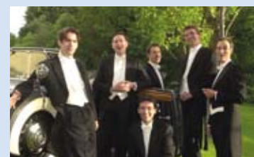
Die „Pinguin-Singers“ sagen adé – siehe S. 10