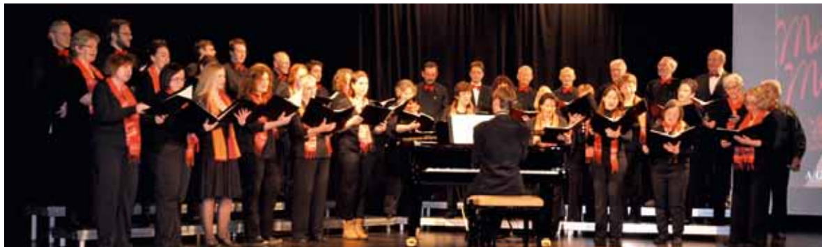
Standards, Evergreens und Schlager zwischen Nostalgie und Amusement gaben die Musikfreunde Laufen bei ihrem Faschingskonzert in der gut besuchten Salzachhalle zum Besten.