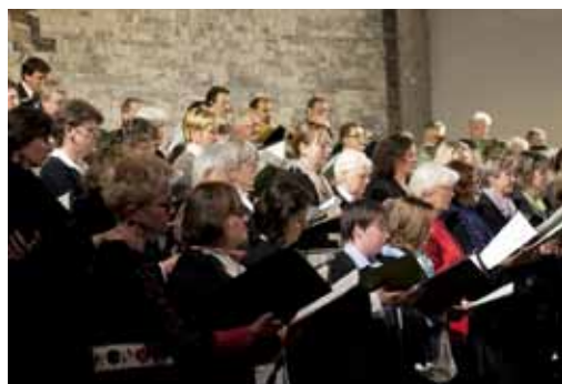
Chorwoche 2011, Gemischter Chor

Es gibt ja nun diese Initiative „Singen kennt kein Alter“ zur Förderung des Singens mit älteren Menschen. Das Projekt wendet sich zwar vorwiegend an Altenheime und Pflegeeinrichtungen. Es wird dabei aber auch an Sängern gedacht, die zu alt für „ihren“ Chor geworden sind und denen daher nahe gelegt wird, aufzuhören. Für die Betroffenen ist das eine demotivierende Erfahrung, wobei man auch die andere