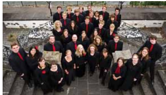
Deutscher JugendKammerchor Neuwied 2011