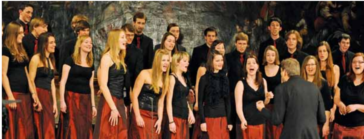
Cantanima Steiermark