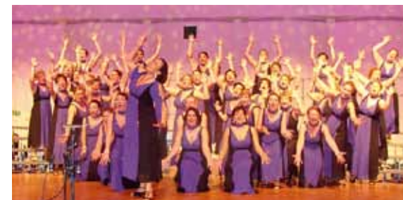
Harmunichs bei der „Show of the Champions“ im Konzerthaus in Dortmund

Münchener Chor Harmunichs belegten 2. Platz bei den Deutschen Barbershop-Meisterschaften in Dortmund 2. – 4. März 2012