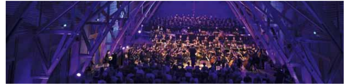
Konzert Florianstadt 2011

Anm.d.Red.: Aus dem BSB haben sich auch einige Chöre angemeldet: Der Münchner Mädchenchor, Cantica Nova Holzkirchen, die Wolperdinger Singers Abensberg und die Haager Spatzen.