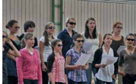
Chorwoche 2011, Jugendchor

Auf euch wartet ein swingendes, erlebnisreiches und spannendes Chorwochenende mit viel Musik und Bewegung! Gemeinsam mit jungen Sängerinnen aus den Chören des gesamten BSB-Gebietes werden Stücke unterschiedlichster Charaktere mit dem Schwerpunkt auf Literatur aus dem Pop- und Jazzbereich einstudiert werden. Neben der chorischen Arbeit und stimmbildnerischen Elementen werden auch Bewegungselemente und kleinere Choreographien mit in die Probenarbeit einfließen. In einer kleinen Aufführung am Ende der Freizeit können Eltern, Geschwister, Großeltern und alle Interessierten das Ergebnis der Probenarbeit bewundern.