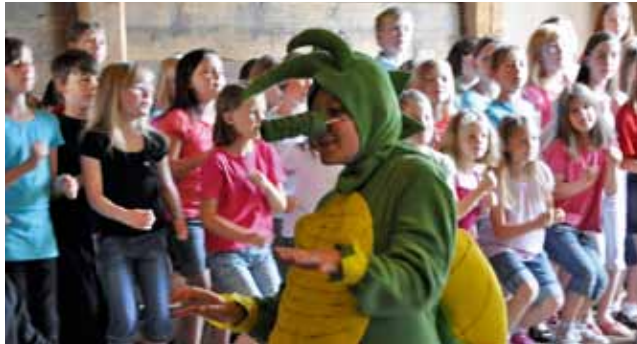
Kinderchortage 2010

Auf euch wartet ein lustiges, erlebnisreiches und spannendes Chorwochenende! Gemeinsam mit Kindern aus den Chören des gesamten BSB-Gebietes wird ein Singspiel einstudiert werden. Neben der chorischen Arbeit und stimm-bildnerischen Elementen wird noch viel Zeit für gemeinsame Spiele und andere Freizeitaktivitäten bleiben. In einer kleinen Aufführung am Ende der Freizeit können Eltern, Geschwister, Großeltern und alle Interessierten das Ergebnis der Probenarbeit bewundern.