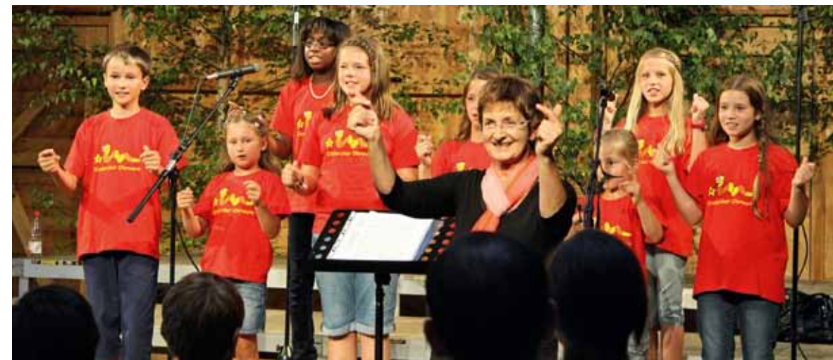
Der Nachwuchs im Singkreis Obermeitingen

lichen Abend. Bereichert wurde das abwechslungsreiche musikalische Programm mit Gedichten zum Thema der Lieder.