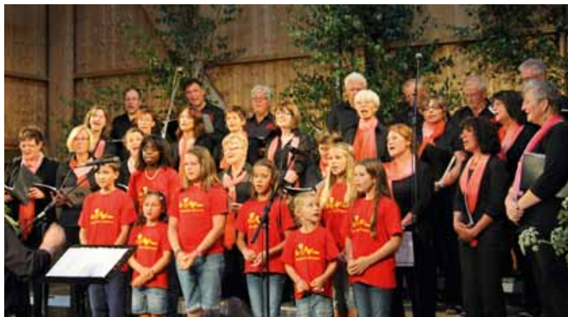
Der Singkreis Obermeitingen