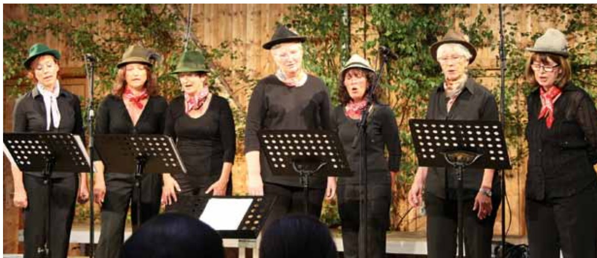
Der Frauenchor im Singkreis Obermeitingen