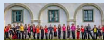
Der brasilianische Chor „Cantares“ (München).