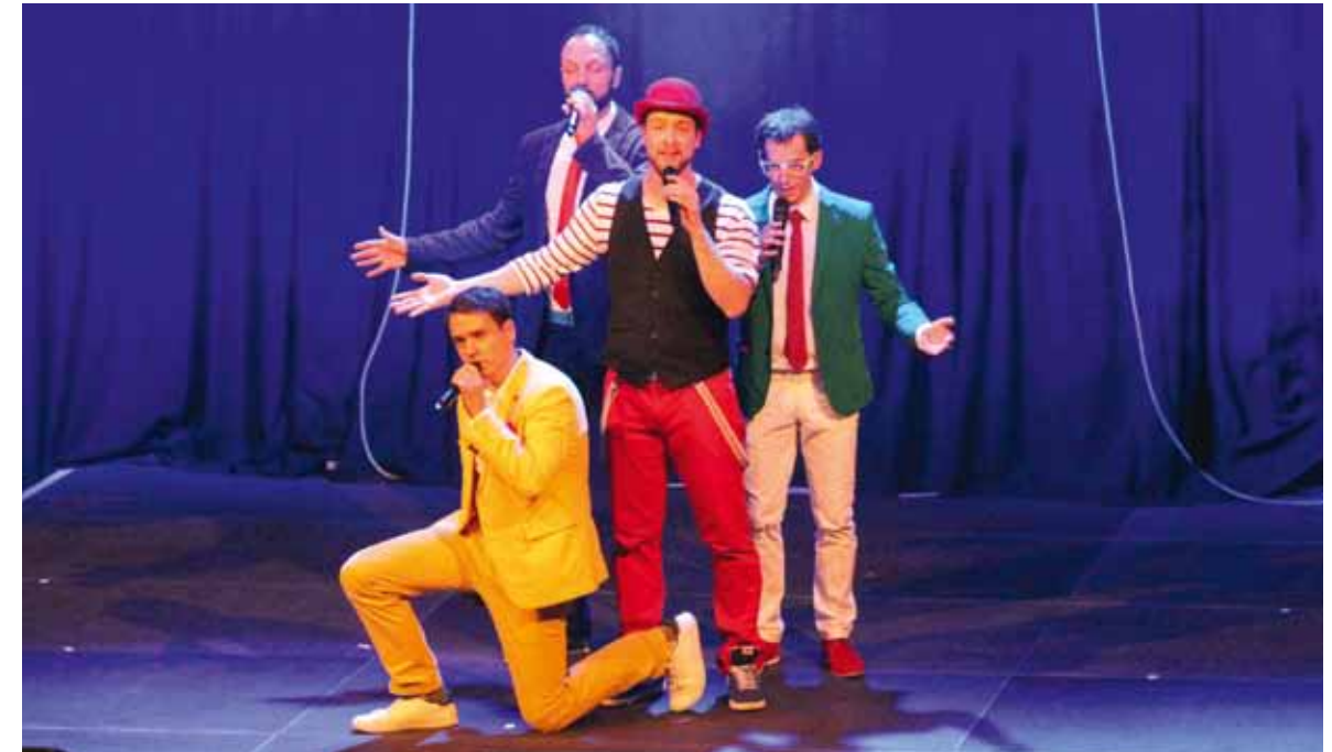
Maybebop während ihres chor.com-Auftritts im Jazzclub domicil