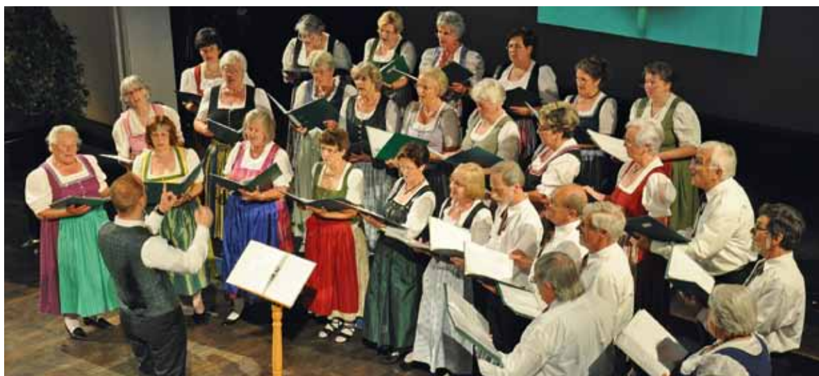
Die Singvereinigung Miesbach beim Jubiläumskonzert