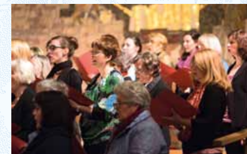
Frauenchor der Chorwoche 2016, (Foto BSB)

Termin: 10.2.-12.2.2017 Freitag, 17.00 Uhr Anreise und Zimmerverteilung, 18.00 Uhr Abendessen, 19.00 Uhr Probenbeginn Sonntag, 12.00 Uhr Mittagessen und anschl. Heimreise