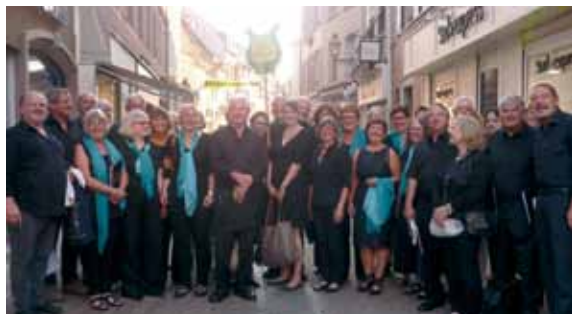
Singkreis Erdinger Moos

Gemeinsam mit Chorale Harmonie unter der Leitung des Elsässers Pierre Schmitt erklangen im Mulhouser St. Stephans Dom geistliche und weltliche Chorstücke, eine gelungene Mischung verschiedener Epochen und unter reger Anteilnahme eines begeisterten Publikums, die bei hochsommerlichen Temperaturen die angenehme Kühle des Kirchenschiffs genossen.