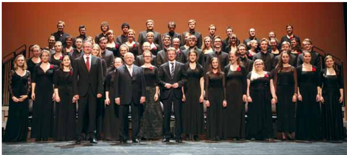
Der Madrigalchor der Hochschule für Musik und Theater München