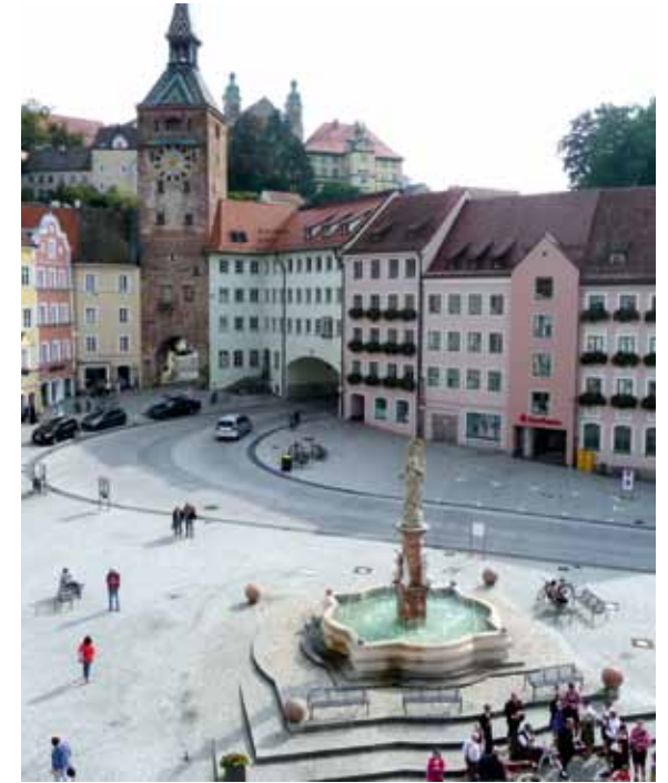
Landsberg am Lech