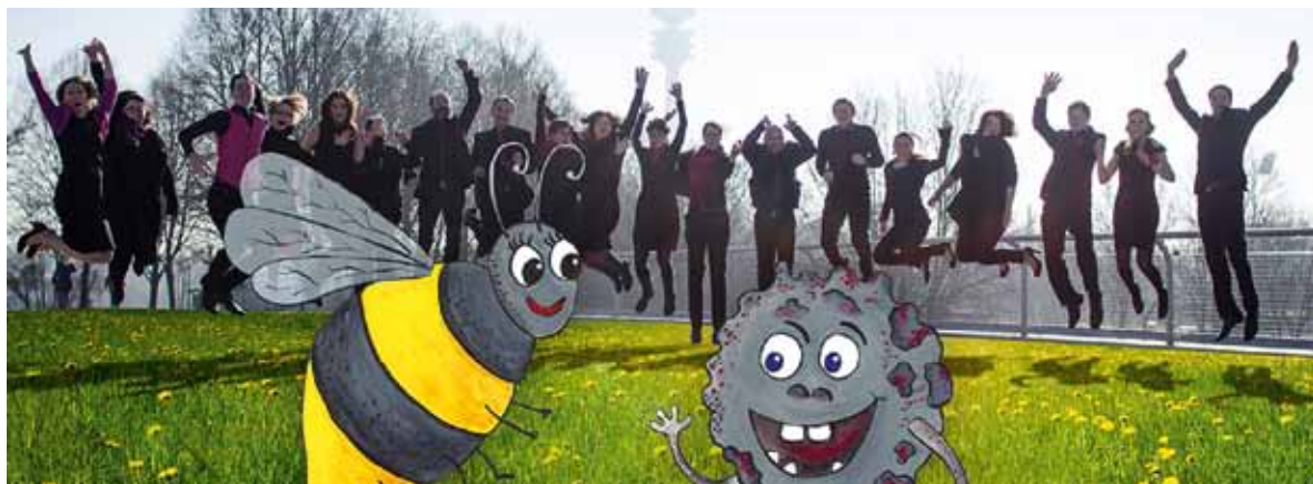
Der Kasimir Chor

Der gelungene gemeinsame Auftritt und die anschließende fröhliche Runde in den Räumlichkeiten des Gastgeberchors wurden mit einer Gegeneinladung für den nächsten Herbst nach Erding beschlossen, in dem der Singkreis Erdinger Moos sein 90-jähriges Bestehen feiern wird. ■ Werner Fleschütz