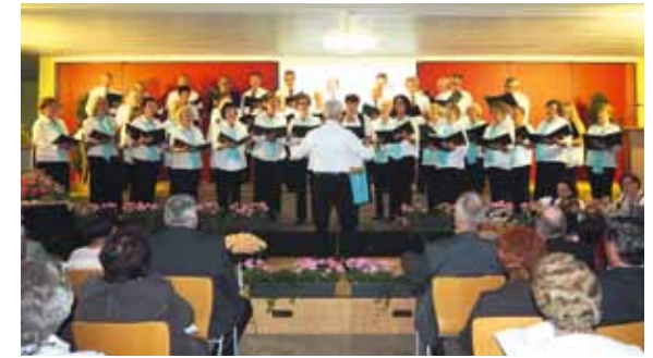
Ein breit gefächertes Repertoire präsentierten die Sängerinnen und Sänger der Liedertafel bei ihrem Jubiläumskonzert.