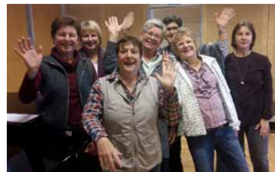
Die Teilnehmerinnen aus Erding