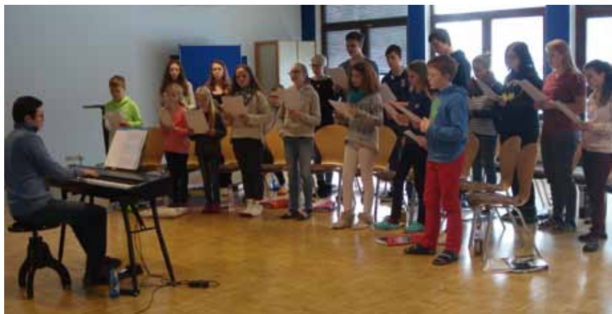
Sound of Voices in Gelbenholzen

Meister trainierten die Sänger im Alter von 10 bis 16 Jahren fleißig ihre Gesangstechniken und das Ensemblesingen, daneben standen Workshops zum Thema Körperhaltung und Atemtraining mit Logopädin Rebecca Lampe auf dem Stundenplan. Freilich hatten die jungen