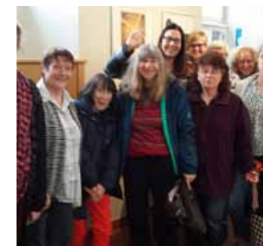
Bei der Abreise...