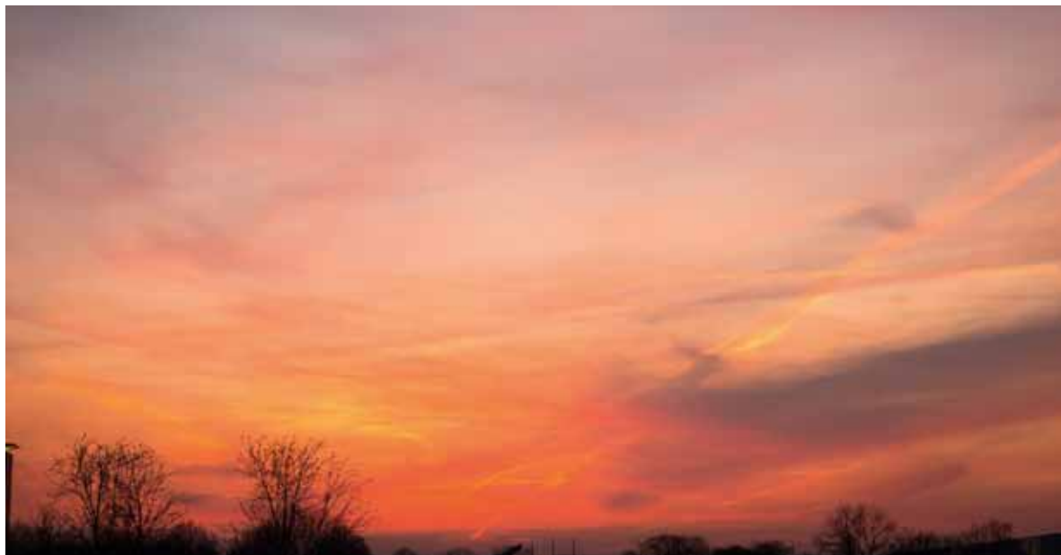
Sonnenuntergang in Oberbayern